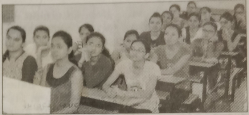
કોર્સીંગ વર્ગના પ્રારંભ પ્રસંગની તસવીર.

રાજકોટ, તા.૨૭: સૌરાષ્ટ્ર યુનિવર્સિટીના અનુસ્નાતક ભવનોમાં અભ્યાસ કરતા છાત્રોને નેટ/સ્લેટ પરીક્ષામાં સફળતા મળે અને રાજ્યના સૌથી વધારે છાત્રો અને છાત્રાઓને અધ્યાપક બનવા જરૂરી યુ.જી.સી. આયોજિત નિશનલ એલીજબીલીટી ટેસ્ટ (નેટ) તથા રાજ્ય સરકારની એમ.એસ. યુનિવર્સિટી આયોજિત સ્ટેટ એલીજબીલીટી ટેસ્ટ (જીસેટ)માં નવા માળખા મુજબ તાલીમ આપવા મુ.જી.સી. અંતર્ગત નેટ/સ્લેટ કોર્સીંગ સેન્ટરના માધ્યમથી સૌરાષ્ટ્ર યુનિવર્સિટી દ્વારા સમયાંતરે સી.સી.ડી.સી. માર્કેટ પેપર-૧ અને જુદાં-જુદાં અનુસ્નાતક ભવનો માર્કેટ વિષય પ્રમાણે પેપર-૨/૩ની તાલીમ “એક્સ્ટ્રા વર્કીંગ ક્લાસ”માં નિ:શુલ્ક આપવાનું આયોજન થાય છે. સૌરાષ્ટ્ર યુનિ.માં યુ.જી.સી.